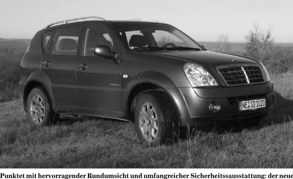
Punktet mit hervorragender Rundumsicht und umfangreicher Sicherheitsausstattung: der neue SsangYong Rexton.