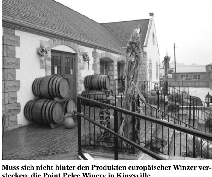
Muss sich nicht hinter den Produkten europäischer Winzer verstecken: die Point Pelee Winery in Kingsville.

Steht einem der Sinn nach Süßem, ist nach der Rückkehr in Windsor »Walker's Candies« anzusteuern. Rob Obeid führt seit 1989 die bereits 1920 gegründete Schokoladen- und Süßwarenherstellung. Der Familienbetrieb