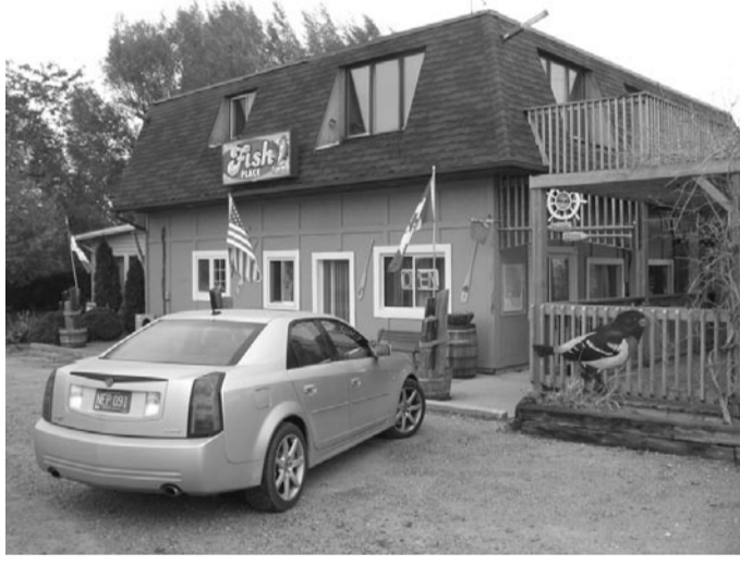
Frisch gefangene Flussbarsche sind die Spezialität von »Paula's Fish Place«.